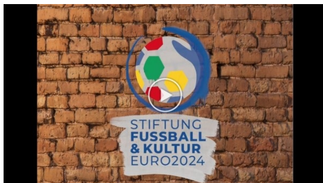
Imageclip Stiftung Fußball und Kultur

Mehr zum offiziellen Kunst- und Kulturprogramm EURO 2024 der Stiftung Fußball & Kultur EURO 2024 erfahren Sie hier .