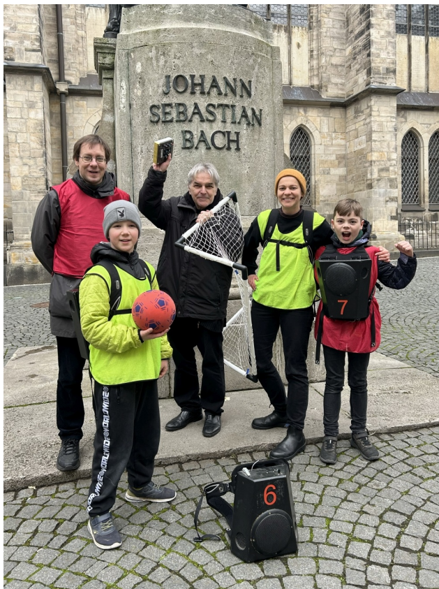
Mit Klangrucksäcken und Kickkunst sorgt Bach am Ball für ein besonderes Erlebnis in der Leipziger Fanzone.

Mehr zum offiziellen Kunst- und Kulturprogramm EURO 2024 der Stiftung Fußball & Kultur EURO 2024 erfahren Sie hier .