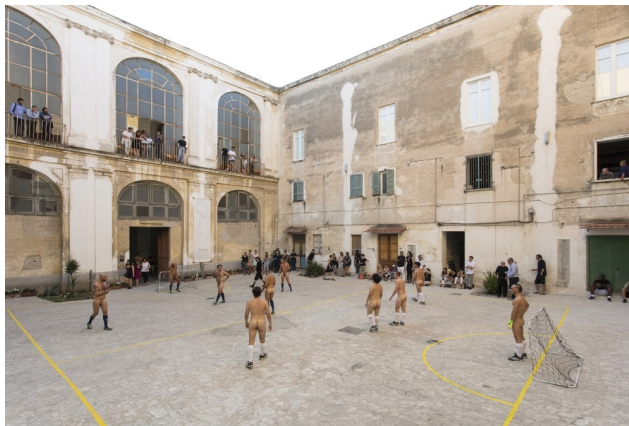
Eddie Peake, Gli Animalì, 2017 © Eddie Peake. Courtesy of Fiorucci Art Trust and The Vinyl Factory

Performance, Musik, Diskurs, Film, Literatur, Architektur, Sport: Das Festival Ballett der Massen im Berliner Haus der Kulturen der Welt (HKW) betrachtet vom 7. Juni bis 14. Juli den Fußball und seine gesellschaftspolitischen Dimensionen. Das Projekt ist Teil des offiziellen Kunst- und Kulturprogramms zur UEFA EURO 2024 und wird von der Stiftung Fußball & Kultur EURO 2024 aus Mitteln des Bundes gefördert.