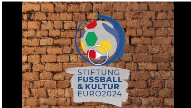
Imageclip Stiftung Fußball und Kultur

Mehr zum offiziellen Kunst- und Kulturprogramm EURO 2024 der Stiftung Fußball & Kultur EURO 2024 erfahren Sie hier .