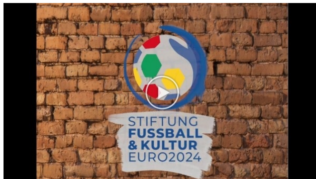
Imageclip Stiftung Fußball und Kultur

Mehr zum offiziellen Kunst- und Kulturprogramm EURO 2024 der Stiftung Fußball & Kultur EURO 2024 erfahren Sie hier .